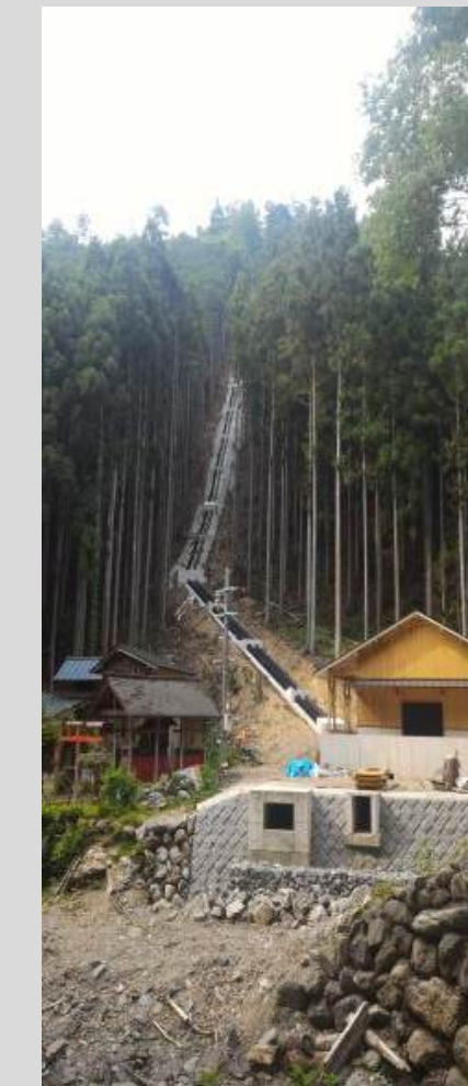
現在復活した発電所